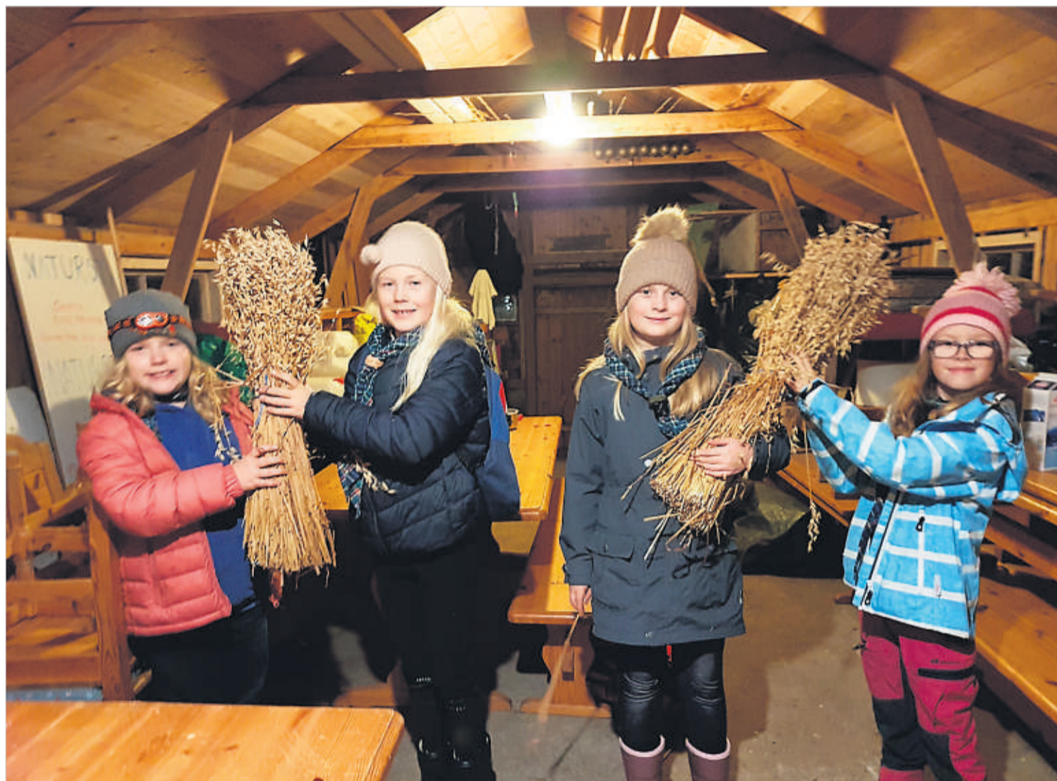
KLARE FOR JULENEKSALG: Småspeiderne er klare for å selge julenek også i år, det vil imidlertid ikke skje fra dør-til-dør som det vanligvis gjør.

Og med det var en ny speiderhverdag født. Hjemmespeiding