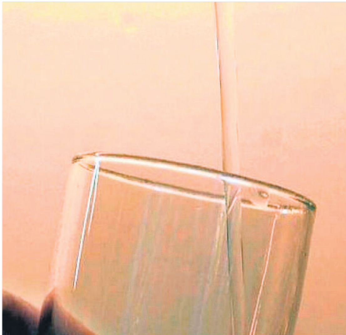
VANN: Vann, vannkran

Det holder ikke å bare plugge vannledningen.